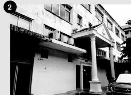
2. อาคารเกียกกาย