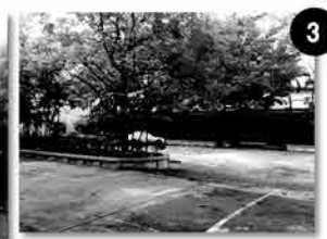
3. ที่จอดรถ พื้นที่ภายในสามารถจอดรถได้ 47 คัน (รวมจอดซ้อนคัน)