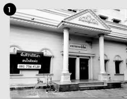
1. อาคารธรรมนิบัติย์

ที่อยู่ 22/27-30 ซ.วัดประดู่ธรรมนิบัติย์ ถ.ประชากรศาสตร์สาย 1 แขวงบางซื่อ เขตบางซื่อ กทม.10800